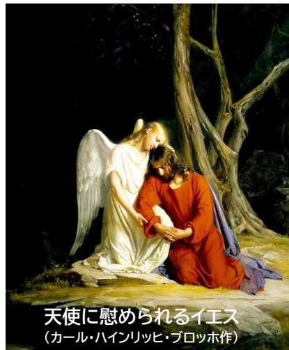
天使に慰められるイエス (カール・ハインリッヒ・プロッホ作)