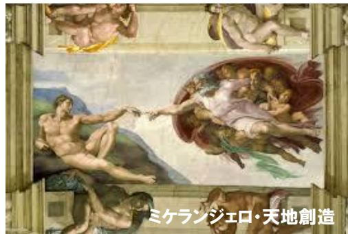
ミケランジェロ・天地創造