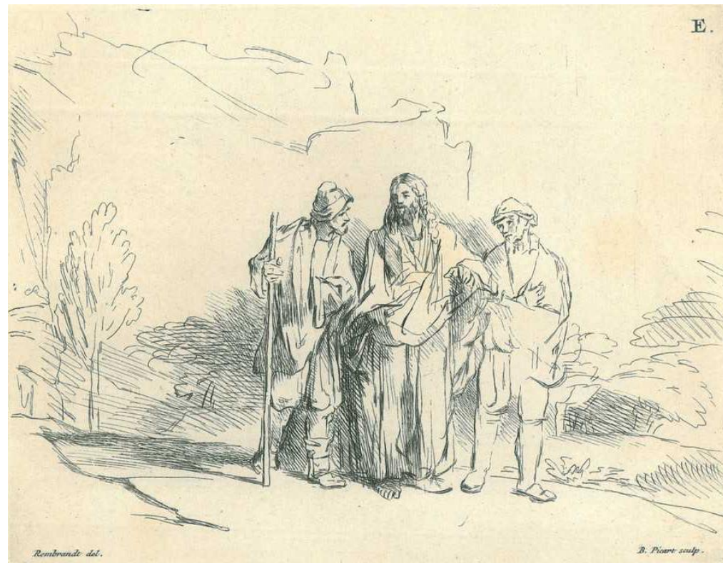
Christ with Two Disciples on the Road to Emmaus レンブラント・ファン・レイン作

イエスご自身が近づいてきて、彼らと一緒に歩いて行かれた。しかし、彼らの目がさえぎられて、イエスを認めることができなかった。ルカによる福音書24章15-16節