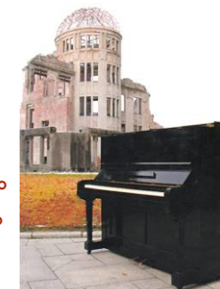
来年1/22に運ぶ被爆ピアノ

「あなたがたの父なる神が慈悲深いように、あなたがたも慈悲深い者となれ。人をさばくな。そうすれば、自分もさばかれることがないであろう。また人を罪に定めるな。そうすれば、自分も罪に定められることがないであろう。ゆるしてやれ。そうすれば、自分もゆるされるであろう。与えよ。そうすれば、自分にも与えられるであろう」。