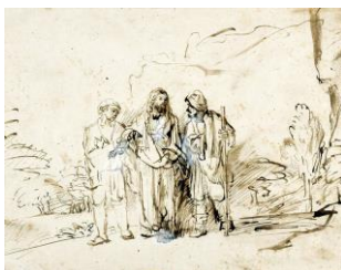
表紙のレンブラントの別のデッサン 「エマオへの道の途上で弟子を持つキリスト」