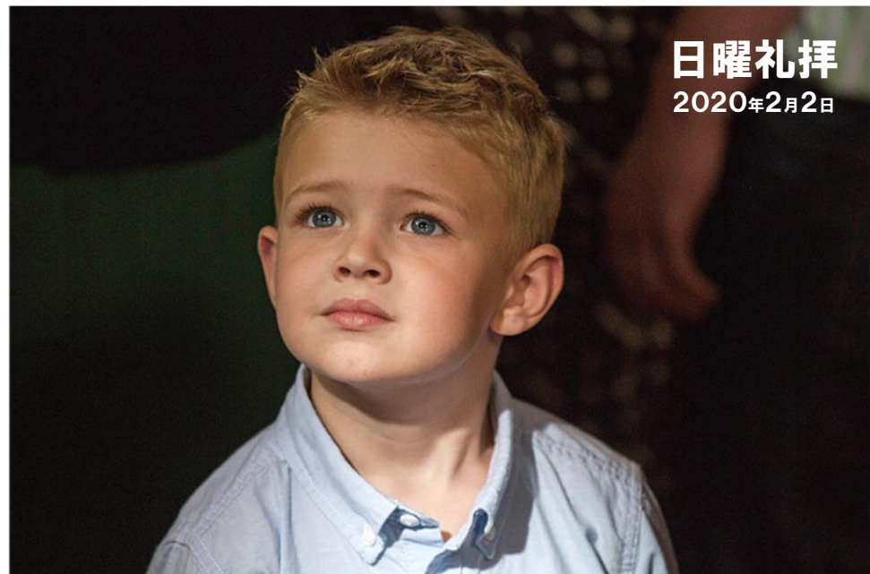
ソニーピクチャーズで配給された2014年の映画「天国はほんとうにある」の一場面