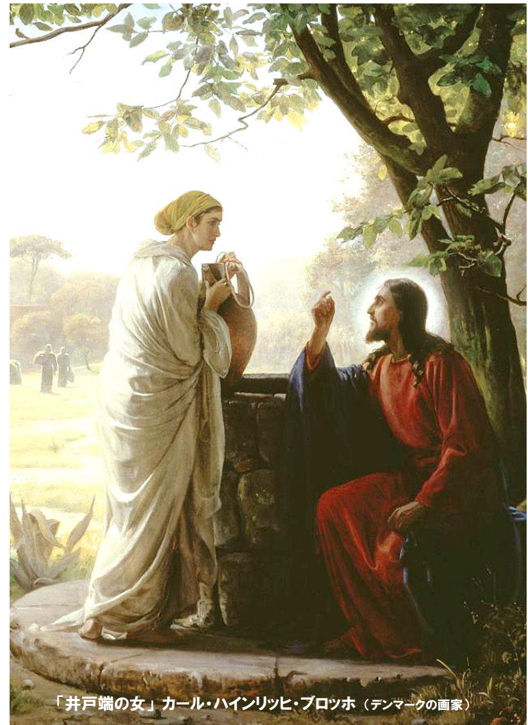
「井戸端の女」カール・ハインリッヒ・プロツホ (デンマークの画家)