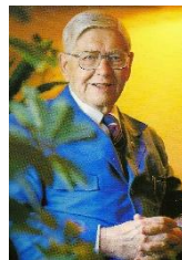
ある宣教師のことば

「世界で一番大きな力を持っているのは、アメリカでも、中国でも、ロシアでもない。 手を組んで祈る人だ！」